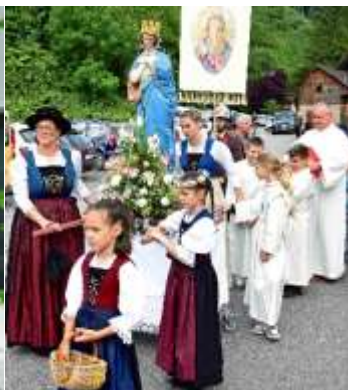
Die Musik, die Feuerwehr, P. Guido und die Mutter Gottes